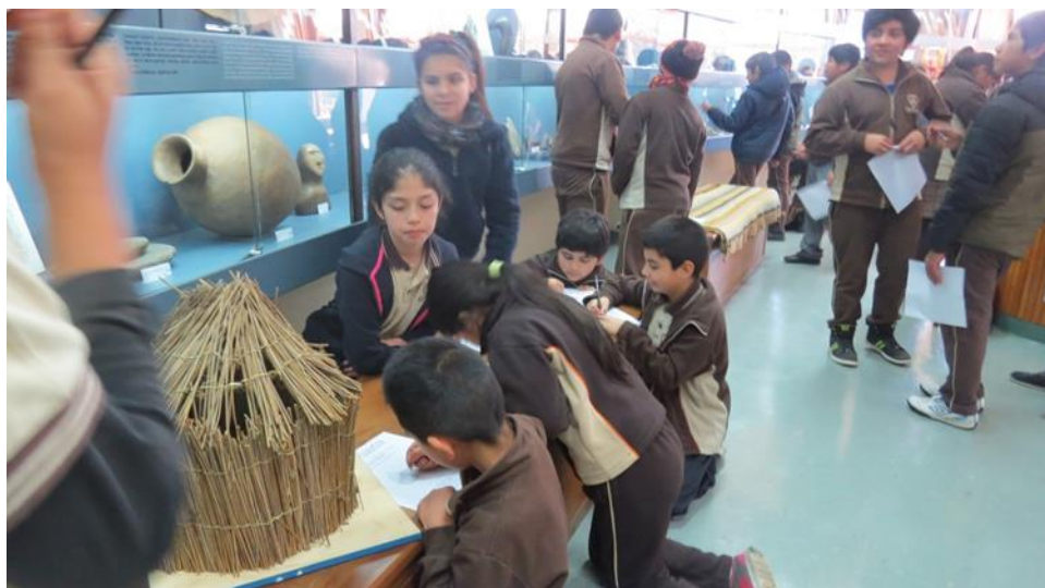
Foto1. Niños trabajan en el museo Leandro Penschulef – miran, seleccionan

En el marco del Día del Patrimonio Cultural, se realizó la ceremonia de premiación y montaje de las obras participantes en el Hall del Campus Villarrica de la Pontificia Universidad Católica de Chile. Tanto estudiantes, académicos y funcionarios del Campus como los establecimientos educacionales que participaron de la convocatoria, presenciaron dicha exposición. El criterio de selección de las obras están ligados al objetivo y responden a los cuatro ejes planteados por el concurso: mirar, investigar, interpretar y crear; dando énfasis a los aportes personales generados en la interpretación de la pieza escogida.